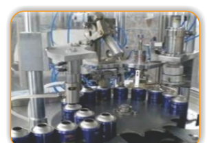
DEO & PERFUME PLANT